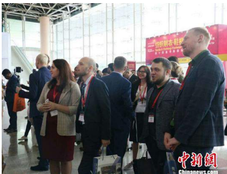
展会吸引外国客商前来寻求商机

本届展会还吸引了来自越南、老挝、尼泊尔、埃塞俄比亚、印度尼西亚、尼日利亚、刚果、安哥拉、塞内加尔等多个国家的驻穗总领事馆的领事官员和商务官员出席，前来对接中国的纺织制衣、鞋机鞋材企业，寻求合作商机。