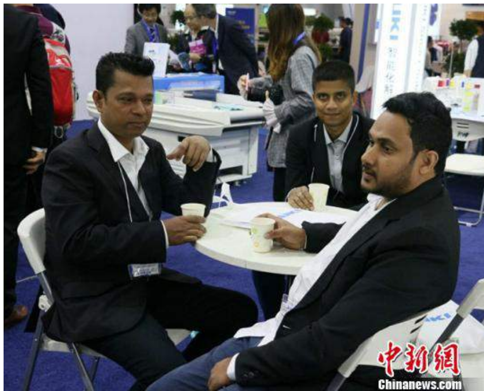
展会上外国客商洽谈合作