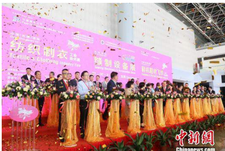
开幕现场

记者在本届展会上发现，随着传统制造业的技术变革，采用自动化设备、人工智能机械已经成为中国纺织制衣、鞋机鞋材企业的主流。过去需靠大量人力、难以自动化的车缝制程，如今通过新技术只要把衣料夹在两片塑料版上，“唰唰唰”几下，一块布料就能变成一件衣服，凭借“一线成衣”黑科技，从一根线到一件衣服仅需40多分钟；展会现场，观众还可体验自动磨边机、自动化机器人生产等制鞋行业的最新智造技术、设备。